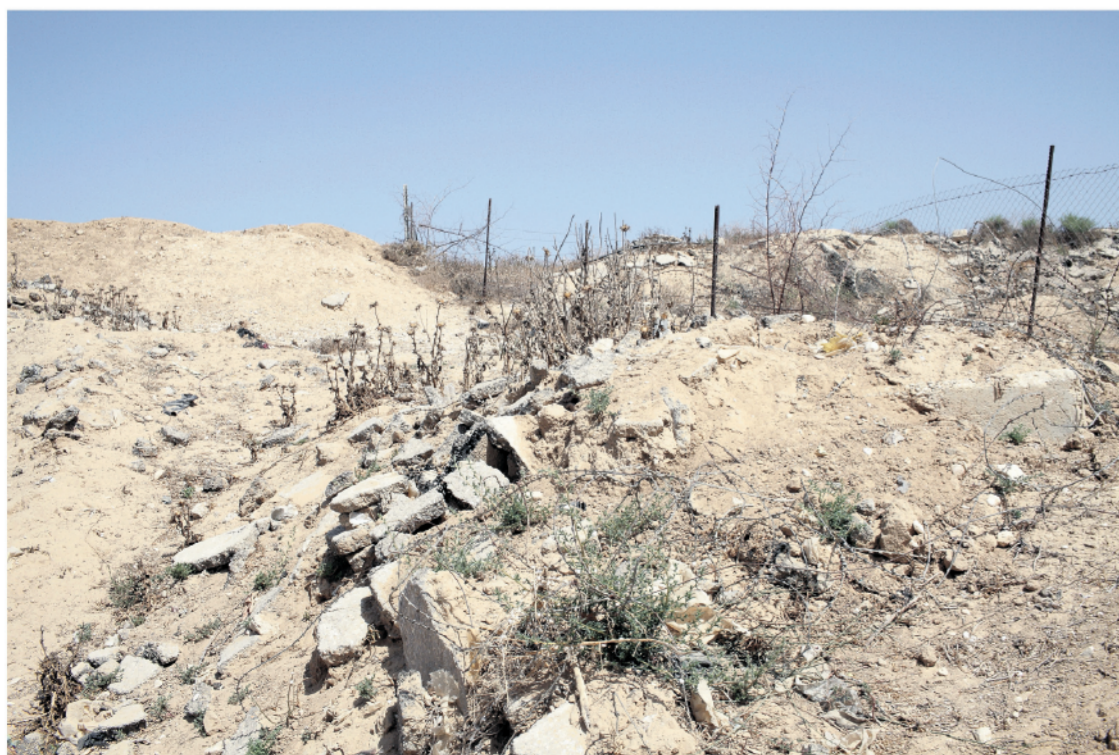
Gaza: N31 24.083 E34 21.684