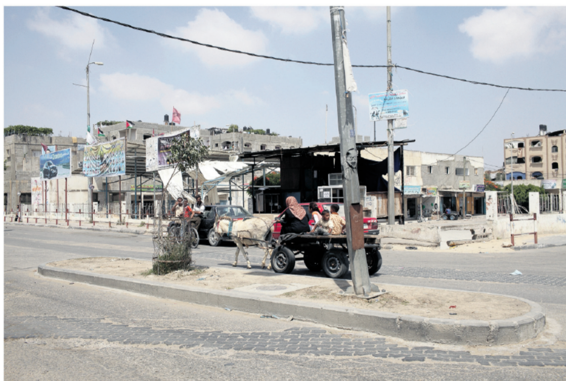
Gaza: N31 32.308 E34 32.277