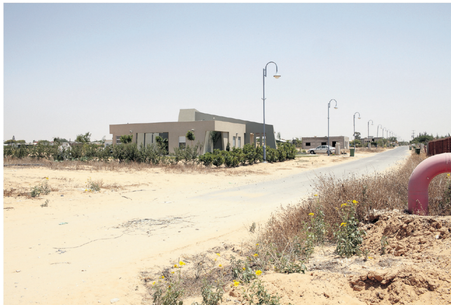
Israël: N31 12.617 E34 19.468