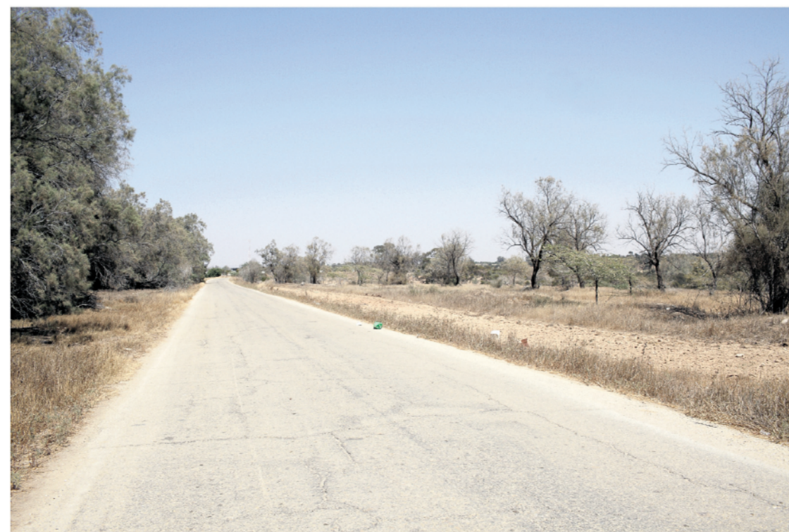
Israël: N31 22.547 E34 23.973.