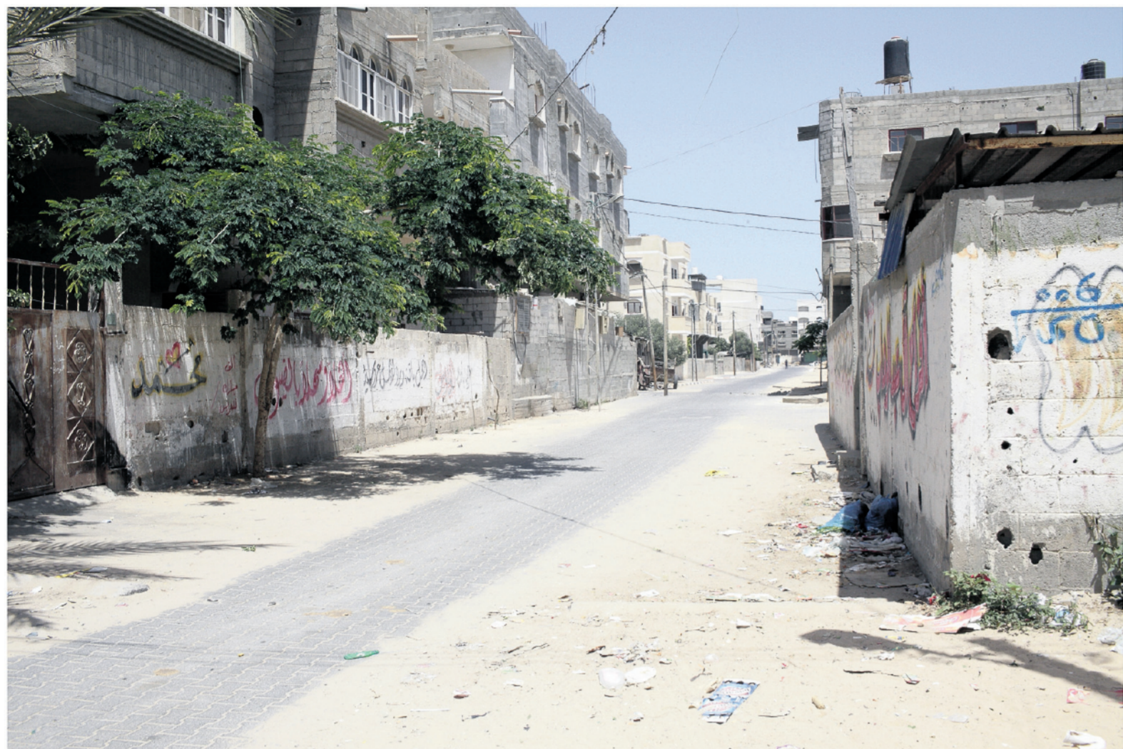
Foto's uit Gaza (links) en de corresponderende plek over de grens met Israël (rechts), met coördinaten: N31 16.453 E34 15.977