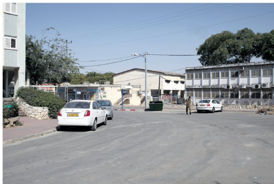
Israël: N31 31.565 E34 35.364